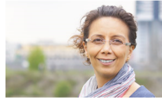
Sabiha Cetinkaya 3. Vizepräsidentin